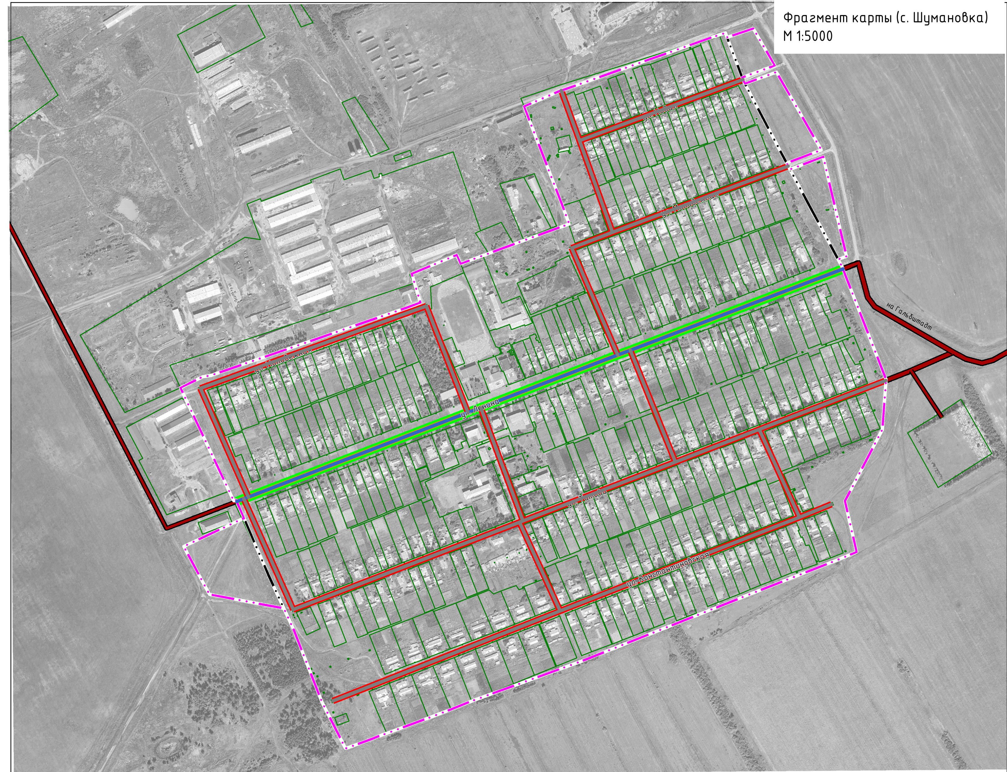
Фрагмент карты (с. Шумановка) М 1:5000